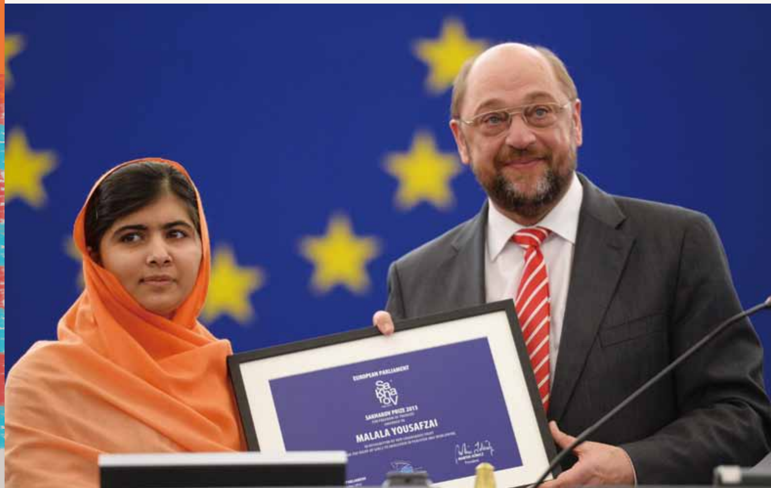
② 歷經恐怖的槍殺事件， 馬拉拉 仍然致力為兒童教育發聲，榮獲歐洲議會最負盛名的「沙卡洛夫人權獎」。