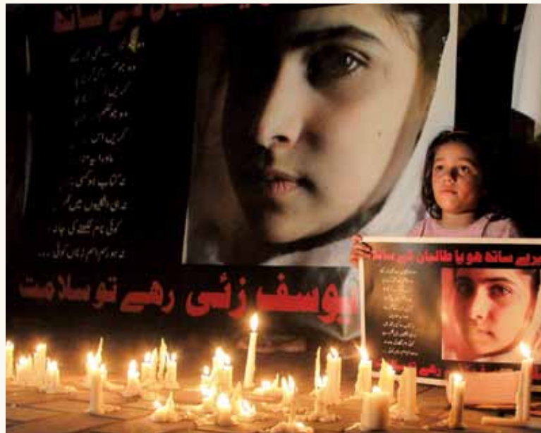
① 馬拉拉 為教育發聲卻遭到槍擊的遭遇，令人心疼。圖中這位 巴基斯坦 的小女孩正在為 馬拉拉 祈福，希望他能醒來，繼續展現他的勇敢。

馬拉拉 是一個1997年7月12日誕生於 巴基斯坦 西北 史瓦特 縣的女孩。 史瓦特 是一個狹長的山谷地，風